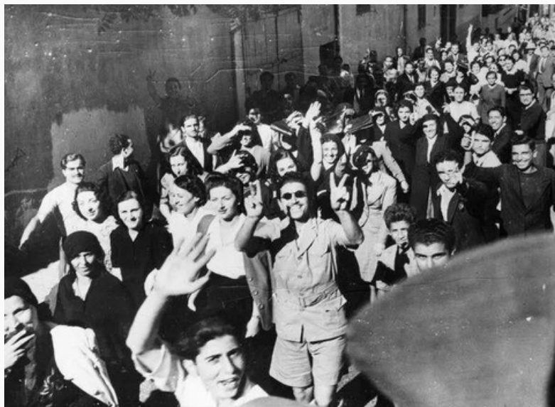
Civiles en 1943.

En agosto de 1943 se llevaron a cabo las primeras elecciones en el Líbano, en las que los nacionalistas libaneses, de la mano de Riad al-Solh, descendiente de gobernantes otomanos e independentista durante el Mandato francés, ganaron las elecciones. Poco después se firmó el Pacto Nacional, que renunciaba a ideales de superioridad maronita (grupo cristiano originario del Líbano) y a la unidad con Siria a favor de la independencia del país. Se basó en