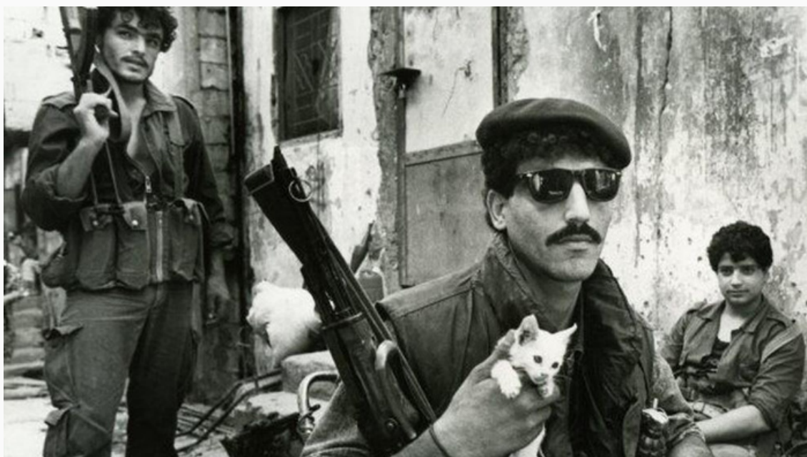
Civiles 1943

Así el país se masacró entre sí. El 13 de abril de 1975 la guerra civil había comenzado, que terminaría involucrando en el conflicto armado no solo a ejércitos extranjeros sino también a la ONU.