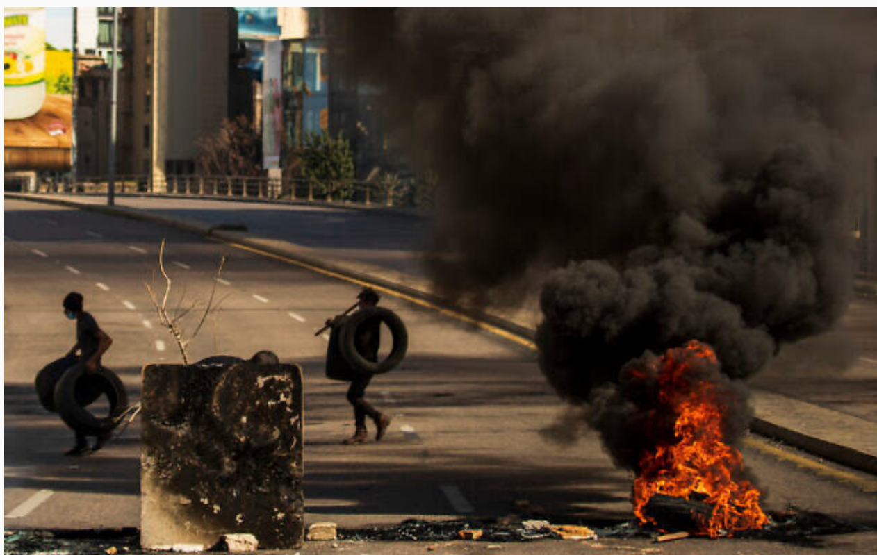
Protestas en 2021

A partir de esto se pueden plantear diversas preguntas sugerentes que pueden informar al lector sobre porqué es importante, desde la vinculación del grupo terrorista Hezbolá que actualmente gobierna el Líbano y participa de la guerra civil en su país vecino de Siria, donde intervienen fuerzas internacionales. ¿Cómo impacta una guerra civil en un país vecino cuyos habitantes están sumamente armados? También es importante preguntar si esto impacta en la inestabilidad económica y política, sobre todo teniendo en cuenta los intereses saudíes e iraníes en el país. A su vez, se podría plantear la cuestión de si el conflicto permanente con Israel ha afectado la tenencia de armas en el país. La Ciudad de Armas está atravesada por conflictos de representación y a su vez por crisis económicas: hay malestar en partes en un país donde la convivencia no es óptima