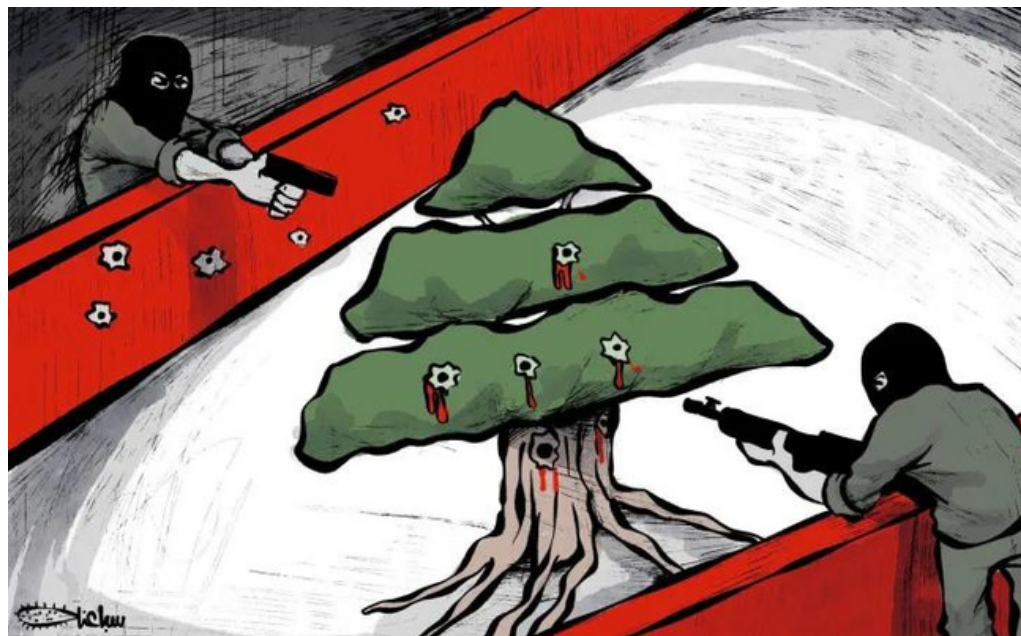
Protesta en Beirut, Líbano - Caricatura [Sabaaneh/Monitor de Oriente].

¿Por qué hoy sigue siendo importante? P. 06