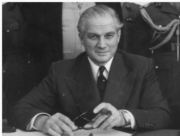
Camille Chamoun

Desmond Stewart categoriza los eventos ocurridos en 1958 en el Líbano como la primera revolución popular en el mundo árabe ya que la caída del Rey Fuad II de Egipto en 1953 fue debido a un golpe de Estado llevado a cabo por Gamel Abdal Nasser. A su vez, el nuevo presidente aumentó el tamaño del ejército a quince mil hombres, y como si la vasta tenencia de armas por parte de la población civil pareciera poco, para 1975 milicias palestinas se habían establecido en suelo libanés. Luego de la guerra Árabe-Israelí de 1967 organizaciones terroristas palestinas como la Organización de Liberación Palestina (OLP) liderada por Yasir Arafat habían elevado el número de ataques a Israel desde el Líbano. El creciente número de palestinos en el país fenicio (15% de la población en 1975) y su enfrentamiento con el ejército ya cocinaba el caldo de cultivo para la consiguiente guerra civil.