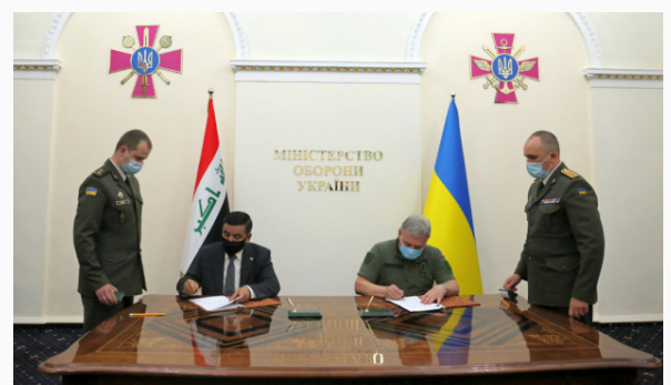
Los ministros de Defensa de Ucrania y la República de Irak firmaron un memorandum de entendimiento militar en 2020

Tanto Irán como Iraq ven en Rusia un aliado con el cual contar para diferentes objetivos. La presencia de sus tropas en Medio Oriente evidencia la lucha contra la influencia estadounidense en la región, tal como la lucha contra el Estado Islámico y grupos revolucionarios que pretenden derrocar a los regímenes actuales. Es menester destacar que las alianzas actuales no son completamente coyunturales, sino que han formado parte de las estrategias de los gobiernos para acabar con la influencia estadounidense, tanto en Medio Oriente como en Europa del Este.