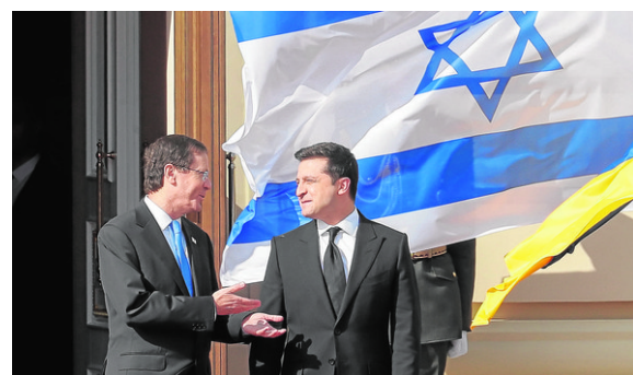
El presidente de Ucrania, Volodimir Zelenski, con Isaac Herzog, presidente de Israel