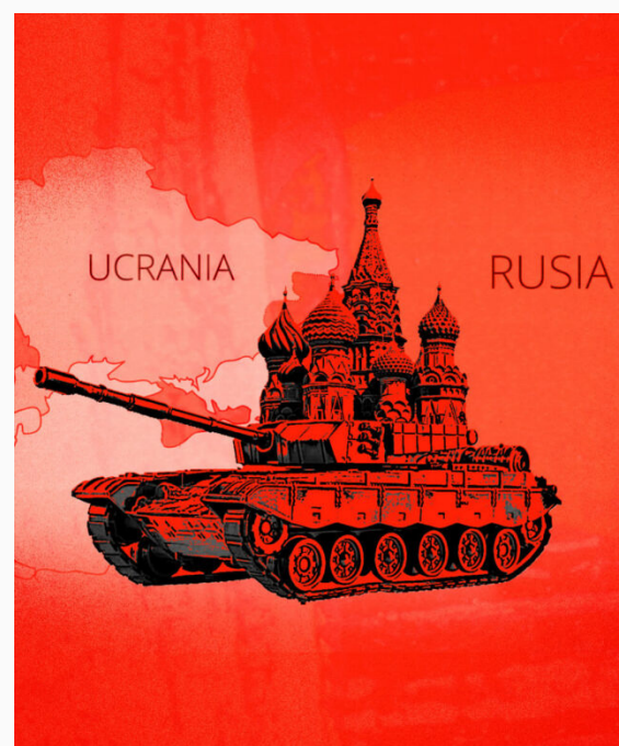
Guerra Rusia Ucrania

“Nuestro principal objetivo es auxiliar a la gente de la zona del Donbass y a las repúblicas populares [Donetsk y Lugansk], a las cuales reconocemos. Nos vimos obligados a hacerlo, desafortunadamente, porque las autoridades de Kiev, impulsadas por Occidente, se rehusaron a cumplir con los Acuerdos de Minsk”. Así declaraba Putin en una entrevista (CNN, 2022) lo que calificó como “objetivos nobles”. Basado en un discurso nacionalista, instaba a la liberación de esos pueblos étnicamente rusos, oprimidos por el “gobierno nazi ucraniano” (RT, 2022). A su vez, su coqueteo con Occidente, y específicamente con la OTAN, preocupaba a Rusia por la posibilidad de perder un Estado tapón, lo que ponía en riesgo su seguridad e integridad territorial. Con esta motivación, actuando como beligerante pero considerándolo como “una operación especial para desmilitarizar” al país vecino, invadió Ucrania. El gobierno, al verse agredido, respondió bajo el Art. 51 de la Carta de Naciones Unidas (legítima defensa). Las acusaciones originales eran por: quebrantamiento de la paz, actos de agresión, violación territorial e inmiscusión en asuntos internos de un tercer Estado, todos actos que acarrearán responsabilidad internacional. Debido a la escala del conflicto, actualmente existen líneas de investigación sobre probables crímenes de guerra, agresiones de lesa humanidad y el uso de armas químicas y/o biológicas.