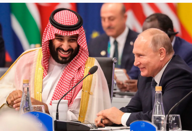
El príncipe de Arabia Saudita con el presidente de Rusia