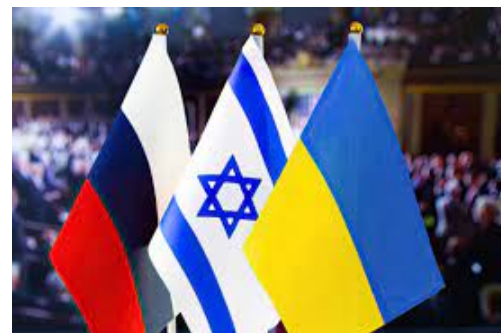
Banderas de Rusia, Israel y Ucrania

Es debido a esta estratégica relación con ambas partes que Israel, similar a lo que ocurre con Turquía, se vuelve un negociador ideal para resolver la disputa internacional, ya que ambos Estados confían en él. Como destacamos ut supra, el conflicto ruso ucraniano no es novedoso ni reciente. Según The Jerusalem Post, en un contexto de tensión en alza, el año pasado, el primer ministro Naftali Bennett a pedido de Kiev, se había ofrecido como mediador entre las partes (Harkov, 2022). En aquel entonces, Moscú rechazó la oferta. Sin embargo, una vez iniciada la situación de beligerancia, tras un reiterado pedido de Zelensky, Israel ahora sí estaría buscando acercar ambas posturas. Un ejemplo de ello es la serie de encuentros y conversaciones telefónicas que estuvo manteniendo Bennett con Putin, Zelensky y hasta el canciller alemán, Olaf Scholz (Itondagol, 2022). Ya finalizando el mes de marzo (SwissInfo, 2022), la mediación, en un estado más consolidado, se centró en la cuestión humanitaria y el alto al fuego. Sin embargo, las peticiones imposibles, el descubrimiento de atrocidades (de la mano de las investigaciones abiertas por crímenes de guerra) y el no respeto a los corredores humanitarios previamente negociados, volvieron prácticamente improbable para las delegaciones sentarse en una mesa de conversación con sus contrapartes, aunque Ucrania sigue sosteniendo estar dispuesto a buscar soluciones diplomáticas pero sin abandonar la lucha en el interín (DW, 2022).