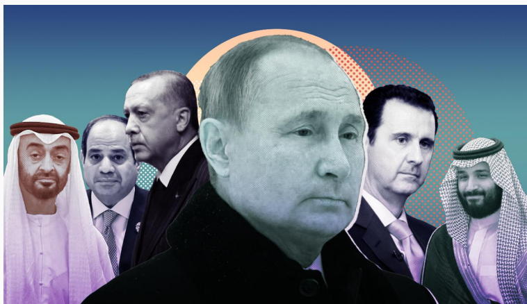
Putin y diferentes dirigentes de Medio Oriente

Por la cantidad de abstenciones que hubo para la suspensión de Rusia del Consejo de Derechos Humanos, se podría suponer que la mayoría de los países del Bloque no son los únicos guiándose con esta estrategia de ambigüedad, una postura difícil de mantener en casos extremos. Algo necesario de remarcar es que estas posturas híbridas cambian constantemente y se acercan a un bando o al otro según convenga el contexto. Por ejemplo, los vínculos tanto con Rusia como con Estados Unidos no impidieron que Israel votase a favor de la medida, porque así le convenía. Lo mismo sucede con Turquía, imposibilitada de mantener neutralidad ante el conflicto. A continuación, desarrollamos algunos casos: