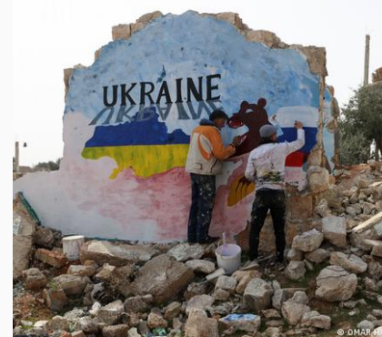
Rebeldes sirios muestran simpatía por Ucrania