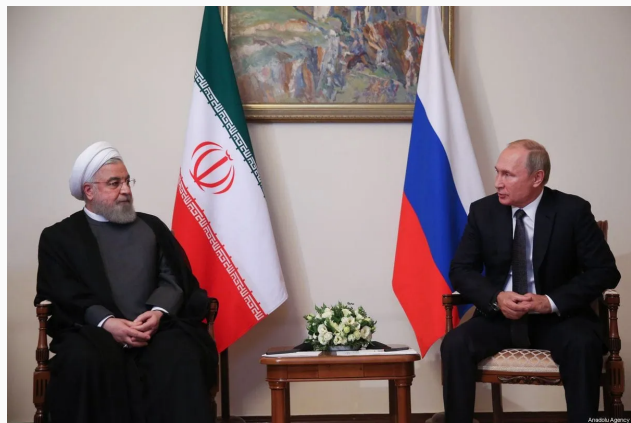
El presidente iraní Hassan Rouhani y el Presidente ruso Vladimir Putin en Yerevan, Irán el 1 de octubre de 2019

La posición de Irán con respecto al conflicto ha ido variando durante el desarrollo del mismo. En un primer momento, el Ministro de Relaciones Exteriores afirmó que la guerra iniciada por Rusia no era la solución correcta para la contienda que se estaba llevando a cabo entre estos dos países, llamando así a la moderación y condenando las intervenciones y actos provocadores de la OTAN (Semana, 2022). Sin embargo, en las últimas semanas se ha observado una mayor cooperación entre Rusia e Irán tanto política como militar, reflejada en los flujos de contrabando de armas que van desde este país e Irak, cruzando el mar Caspio hasta llegar a la ciudad rusa de Astracán (McKernan & Mironova, 2022).