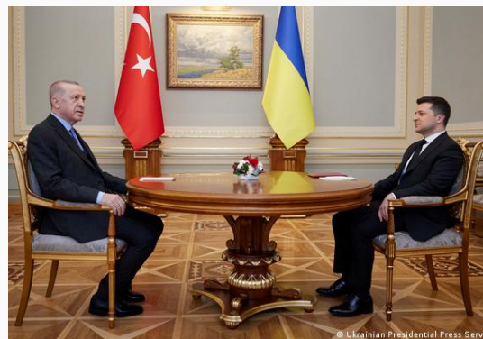
Erdogan y Zelenski