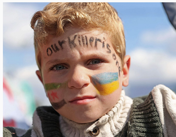
Un niño sirio con la cara pintada con los colores de la bandera ucraniana

La guerra entre Rusia y Ucrania, como todo conflicto bélico, deja muchísimas consecuencias, directas e indirectas. Dentro del primer grupo podemos considerar la gran cantidad de muertos, heridos, desplazamientos forzados y refugiados, la destrucción edilicia ucraniana, las pérdidas económicas, entre otros. En cuanto a las causas indirectas, estas se encuentran más bien ligadas a la interdependencia global y cómo afecta a la economía mundial los precios en alza, el desabastecimiento y la incertidumbre, a lo que también se suma buscar disminuir la dependencia principalmente de los recursos naturales de Rusia. El contexto es complejo, y cada Estado en la arena internacional busca hacer valer sus propios intereses según la estrategia que prevalezca. Como ya se ha mencionado, se trata mayoritariamente de amistades pragmáticas y ambiguas, útiles hasta que tengan valor, pero desde el momento que se rompe el vínculo puede traer graves consecuencias. Al tratarse de un conflicto en curso, nada está definido. La única garantía es que en momentos de crisis, nada es certero y todo lo sólido se desvanece en el aire (Marx y Engels, 1848).