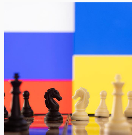
Jugadas estratégicas Rusia Ucrania en tablero de ajedrez