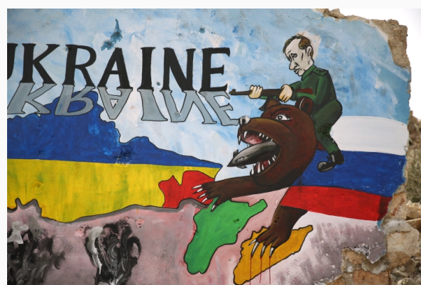
Guerra Rusia Ucrania desde la perspectiva siria