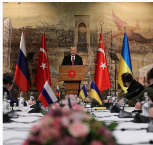
Negociaciones Rusia y Ucrania en Estambul, el 29 de marzo de 2022.

Otro elemento importante que explica la postura siria es la reciente elección del General Aleksandr Dvornikov, conocido también como “el carnicero de Siria” (CNN, 2022) como el nuevo comandante en jefe de la guerra en Ucrania. Cabe recordar también que Dvornikov jugó un papel central en la Guerra Civil Siria en 2015 respaldando a las tropas de Al Assad utilizando su política de tierra quemada. Este apoyo fue fundamental, ya que al enviarle poderío militar, contribuyó a evitar el derrocamiento del mandatario sirio y a inclinar la guerra a su favor.