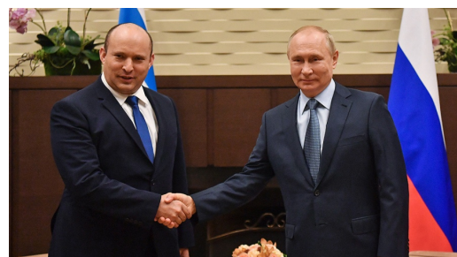
Naftali Bennett y Vladimir Putin