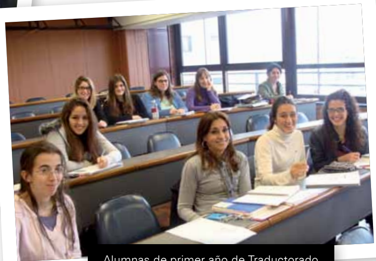
Alumnas de primer año de Traductorado

INGRESÁ A FACEBOOK Y BUSCÁ EL QR DE TU CARRERA