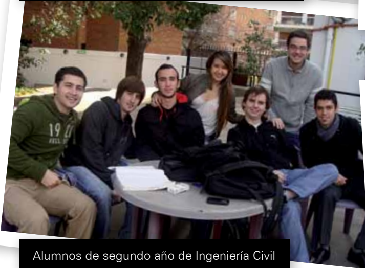
Alumnos de segundo año de Ingeniería Civil