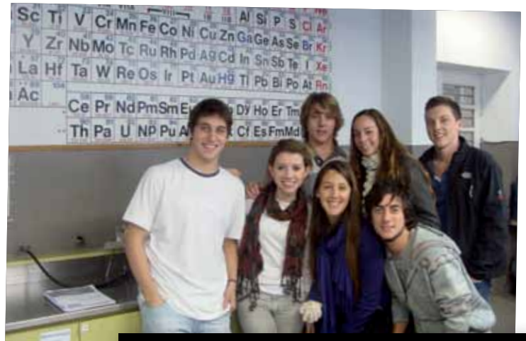
Alumnos de primer año de Farmacia y Bioquímica